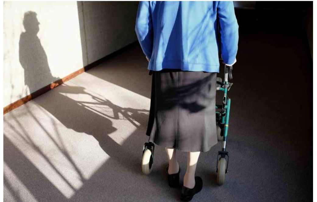
Unterstützen Sie ältere Menschen.

Damit keine Langeweile aufkommt, hier ein paar Beispiele für die neu gewonnene Freizeit. Auf unseren Social-Media-Kanälen findet ihr laufend Ideen und „Challenges“.