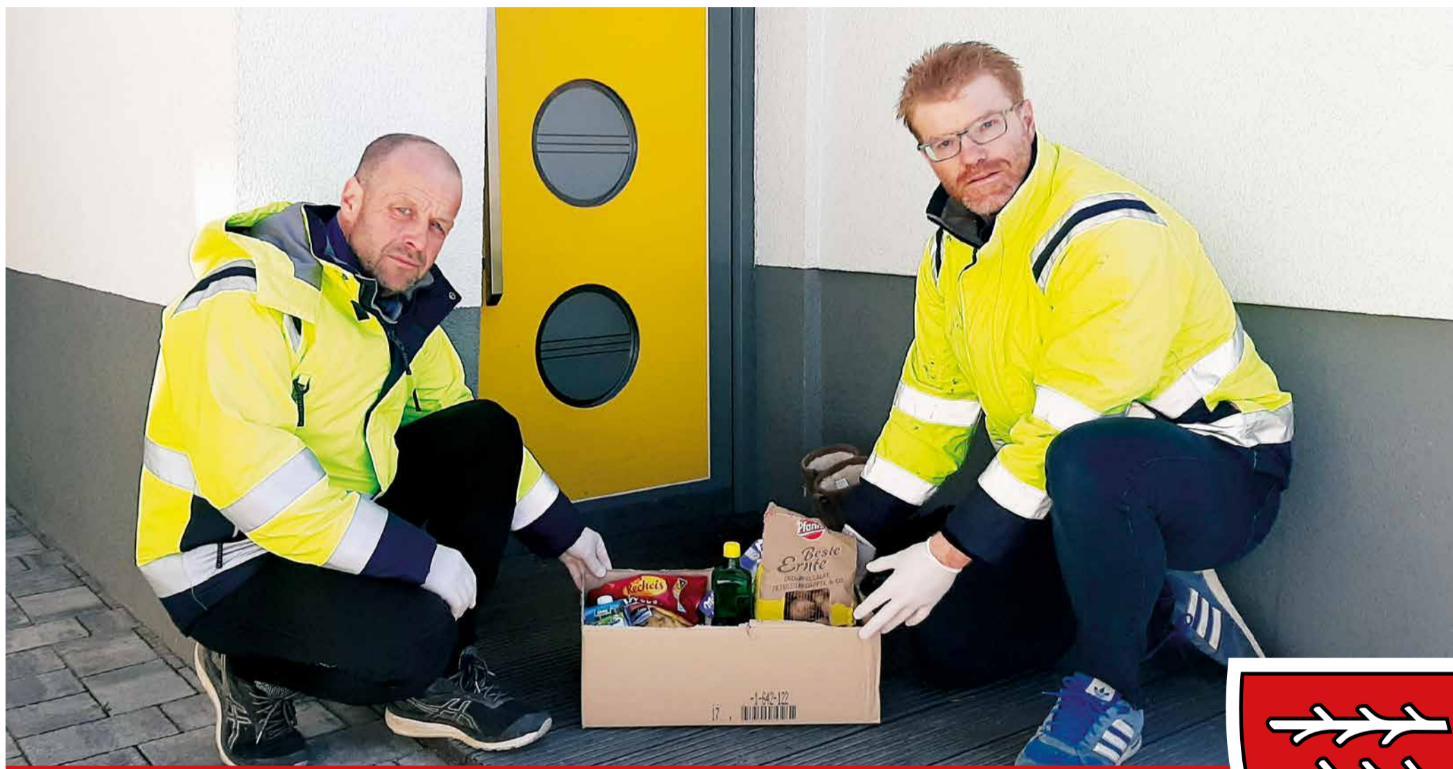
Amtliche Mitteilung: Zugestellt durch Post.at